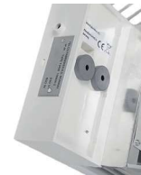
Блок терморегулятора. Вид сзади

Судовые обогреватели для установки в сухих и влажных помещениях. Корпус обогревателя выполнен из алюминиевого профиля, окрашенного в белый цвет, порошковой термостойкой краской. Поставляется с предустановленным электронным терморегулятором и термозащитой от перегрева с ручным сбросом. Для защиты от попадания посторонних предметов, комплектуется верхней защитной решеткой.